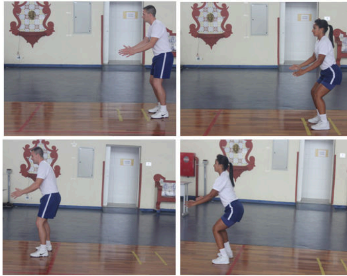
Figura 3 - Teste de salto horizontal.

Obs.: Neste teste, serão exigidos os mesmos padrões de execução para ambos os sexos.