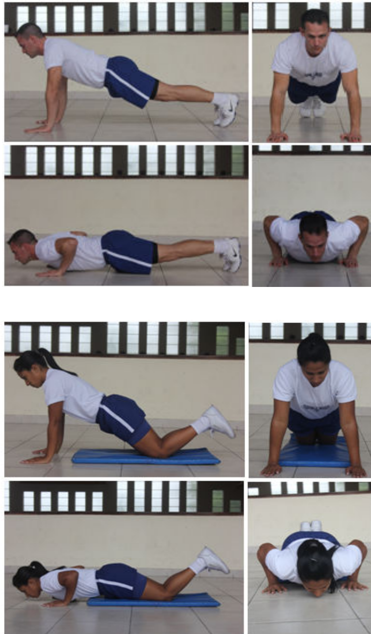
Figura 1 – flexão e extensão dos membros superiores com apoio de frente sobre o solo. Obs.: Neste teste, existem padrões de execução diferenciados para cada sexo (masculino ou feminino).